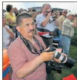
Hobbyfotografen auf dem „Spotter-Hügel“ am Flughafen.

Um 16 Uhr ist der Mega-Airbus in Berlin-Schönefeld gestartet, zur Eröffnung der Internationalen Luft- und Raumfahrtausstellung