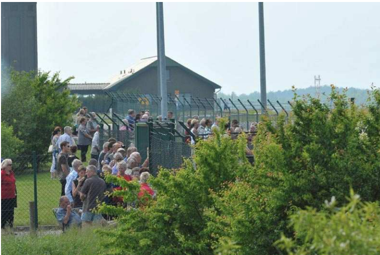
Hunderte Zuschauer verfolgen,...