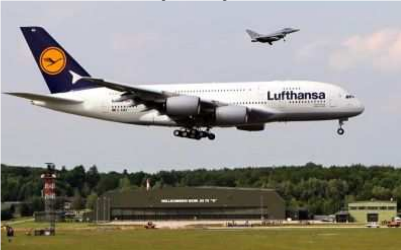
Gigant im Anflug: Der A380 über dem Flughafen Laage.