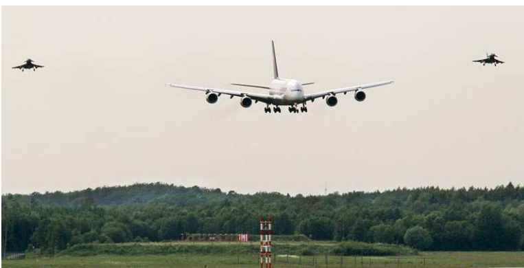
...dann verschwindet der Riesenvogel...