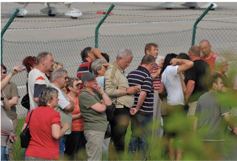
Noch ein letzter Blick,...