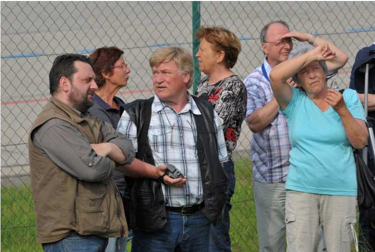
Warten auf den großen Moment: Wann kommt der A380?