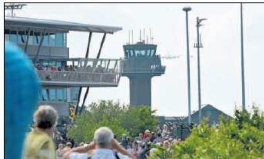
Auf diesen Moment haben alle gewartet: Der Riesenvogel taucht rechts neben dem Tower am Himmel auf.

tief enttäuscht, deswegen wäre ich nicht gekommen“, sagt er und steigt in sein Auto. Dort holen ihn die Gesetze der Schwerkraft ein: Die vielen Besucher haben die enge Zufahrtsstraße hoffnungslos eingeparkt. Nichts geht mehr. Über eine halbe Stunde dauert es, bis sich der Stau auflöst und alle Spotter heimfahren können.