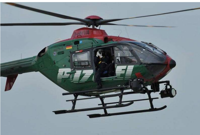
Ein Polizeihubschrauber beobachtet die Menschenmenge, die auf den Airbus wartet.