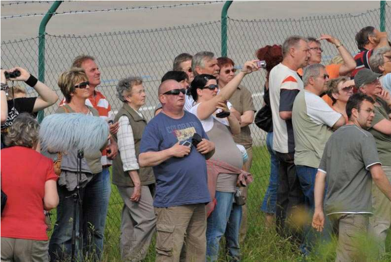
Warten auf den großen Moment: Wann kommt der A380?