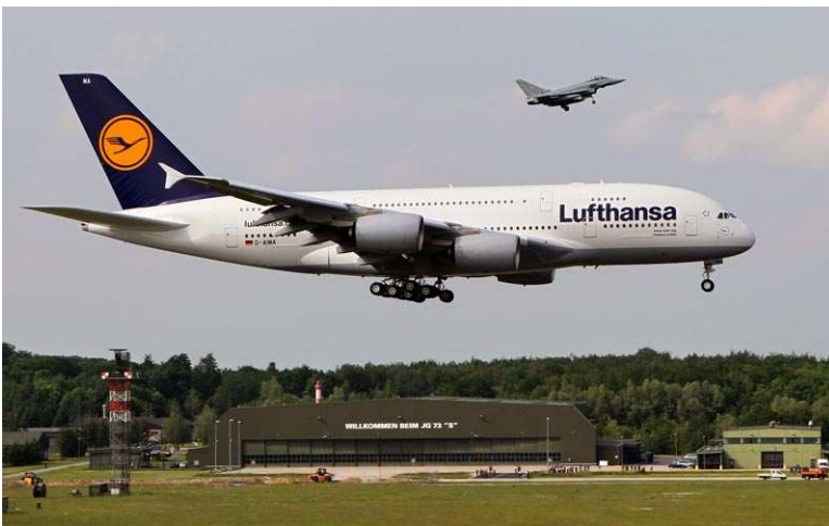
...wie der von Kampffjets eskortierte Riesen-Airbus knapp über die Landesbahn donnert.