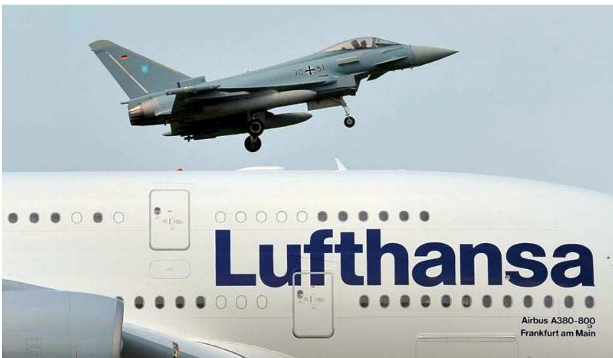
Der A380 wurde von Maschinen des Jagdgeschwaders in Laage eskortiert.